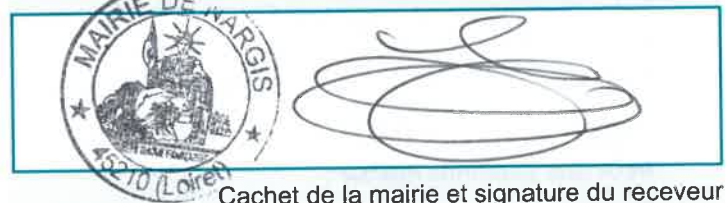
Cachet de la mairie et signature du receveur